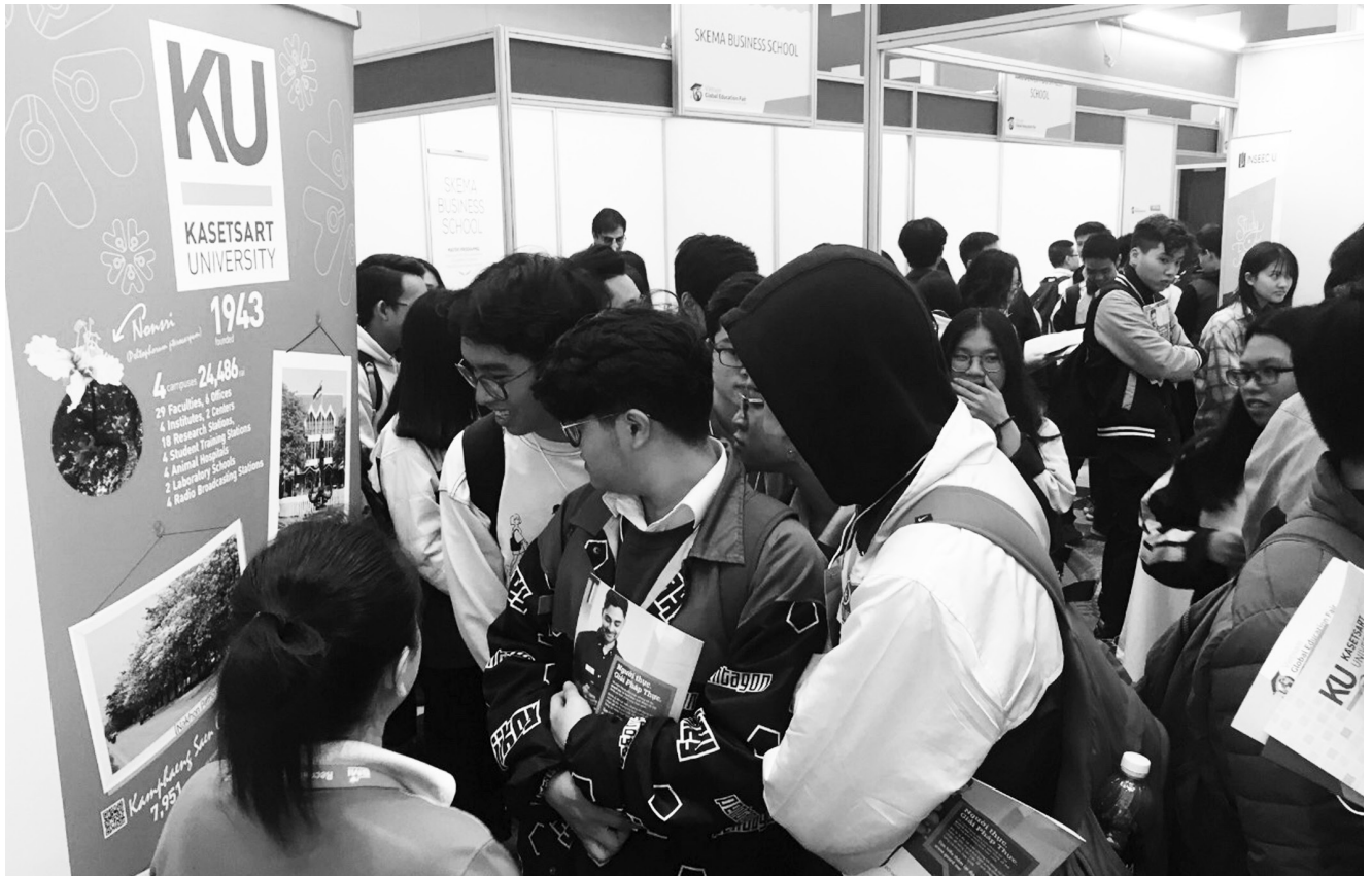
ตารางที่ 10 จำนวนนิสิตที่ได้รับทุนจากโครงการเสริมสร้างศักยภาพนิสิตมหาวิทยาลัยเกษตรศาสตร์สู่สากล ปี 2561 (Outbound)